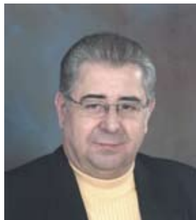
Mot du président

UNE FONDATION SOLIDE, UN AVENIR ASSURÉ !